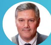
Thomas Lam Député, Président du groupe d'amitié France-Cambodge