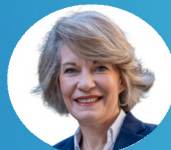
Anne Genetet Votre députée des Français de l'étranger