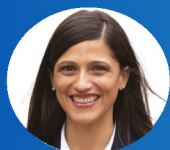
Éléonore Caroit Votre ministre des Français de l'étranger